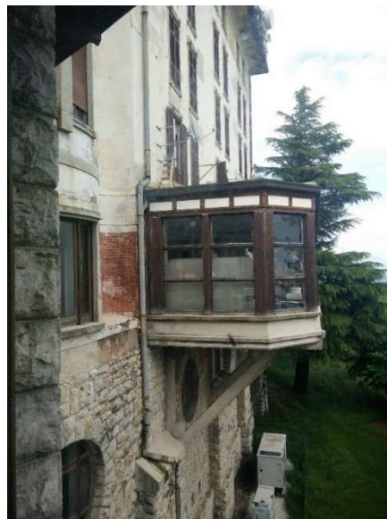
Veranda della sala da pranzo con vista panoramica verso valle