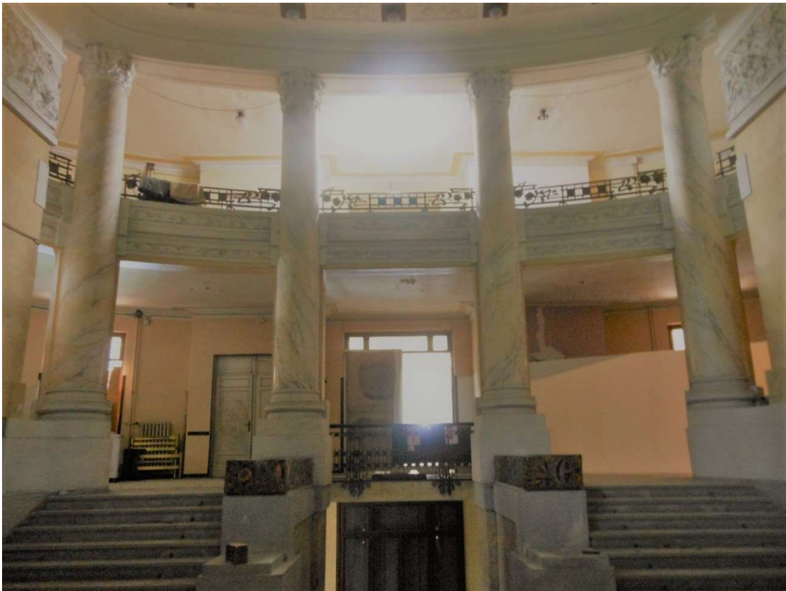
Atrio di ingresso su due livelli

Vidi per la prima volta questo Grande Colosso nel giugno 2016, al fine di poter effettuare un rilievo dello stato di fatto delle strutture portanti. Dall'esterno si nota come la struttura del Grand Hotel si sviluppi, insieme alla funicolare e al ristorante Belvedere, in maniera armoniosa con il profilo del monte. La mia visita ebbe inizio dapprima dalla maestosa hall; per me fu proprio come entrare nel Titanic: un imponente e monumentale ambiente avvolto però da un alone di malinconia per lo stato di abbandono in cui versa tale sfarzo.