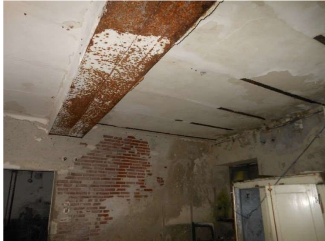
Dettaglio: carpenteria metallica

Il rilievo visivo ha messo in luce fenomeni di ammaloramenti imputabili quasi esclusivamente alla mancanza di interventi di mantenimento dell'edificio. A livello strutturale emergono criticità localizzate, nel balcone della sala da ballo e nella veranda aggettante. Nel balcone della sala da ballo sono stati individuati fenomeni fessurativi piuttosto profondi che potrebbero dare origine ad un fenomeno degenerativo localizzato.