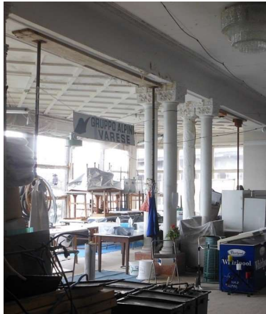
Puntelli a sostegno del solaio nella veranda della sala da pranzo

Altra situazione degna di nota durante la fase di rilievo è data dalla presenza di puntelli verticali nella veranda aggettante, predisposti per evitare possibili fenomeni degenerativi del soffitto sovrastante.