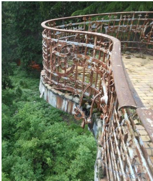
Balconata con dettaglio in ferro battuto della sala da ballo

Il rilievo visivo ha messo in luce fenomeni di ammaloramenti imputabili quasi esclusivamente alla mancanza di interventi di mantenimento dell'edificio. A livello strutturale emergono criticità localizzate, nel balcone della sala da ballo e nella veranda aggettante. Nel balcone della sala da ballo sono stati individuati fenomeni fessurativi piuttosto profondi che potrebbero dare origine ad un fenomeno degenerativo localizzato.