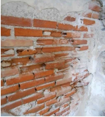
Disgregazione intonaco nella muratura interna

All'interno dell'edificio sono presenti evidenti fenomeni legati al degrado delle murature: nei seminterrati e nelle sale comuni, si rilevano porzioni e zone di distacco dell'intonaco, la corrosione della carpenteria metallica e presenza di muffa sulle pareti.