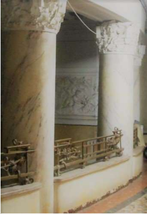
Dettaglio ferro battuto del parapetto nell'atrio si due livelli