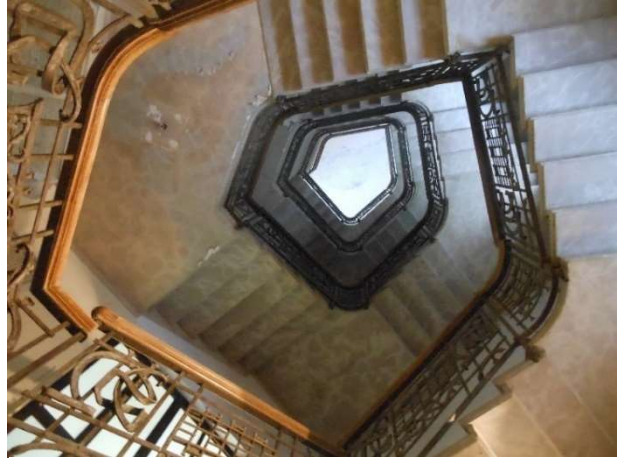
Scala pentagonale che porta agli alloggi degli ospiti

Dal punto di vista strutturale, i materiali che il Sommaruga impiegò furono moltissimi: il calcestruzzo armato, impiegato a partire dalle imponenti fondazioni, muratura, pietrame derivante dalle opere di sbancamento, cemento e ferro battuto, i quali vennero impiegati per la realizzazione di motivi decorativi di natura floreale, costante che ricorre in tutto lo sviluppo del Grande Albergo.