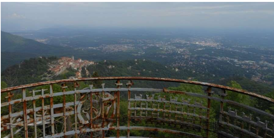
Vista dalla balconata della sala da ballo

Nonostante la presenza di criticità locali dal punto di vista strutturale, il volume strutturale portante globale non presenta segnali che ne comportino un'inadeguatezza statica. Per un'eventuale riqualifica infatti, non sarebbe necessaria una drastica demolizione dell'intero edificio dal momento che non sono necessari interventi invasivi dal punto di vista strutturale. Il volume strutturale è l'elemento esistente da cui poter partire per una possibile rinascita dell'intero complesso.