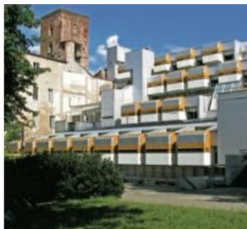
Residenziale La Serra Cappai e Mainardis