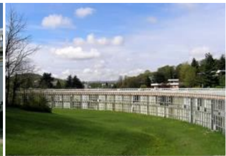
Residenziale Ovest Gabetti D'Isola

La chiesa di San Bernardino è la cappella del convento francescano costruito nel 1456 e consacrato l'anno successivo, poco tempo dopo la canonizzazione di Bernardino da Siena, che gli storici locali ritenevano fosse passato anche a Ivrea durante il suo apostolato.