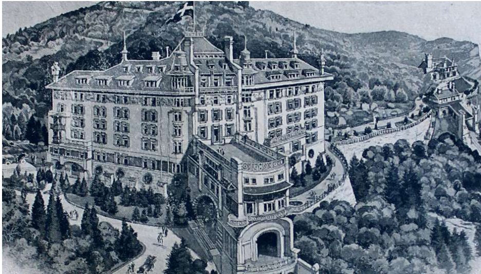
La terrazza panoramica

Teresa, di tornare dai suoi genitori, non ci pensa proprio. Ripercorre veloce il corridoio e poi a balzi di due gradini per volta sale la dolce e lussuosa scalinata pentagonale fino al secondo piano. In un batter d'occhio raggiunge la terrazza panoramica.