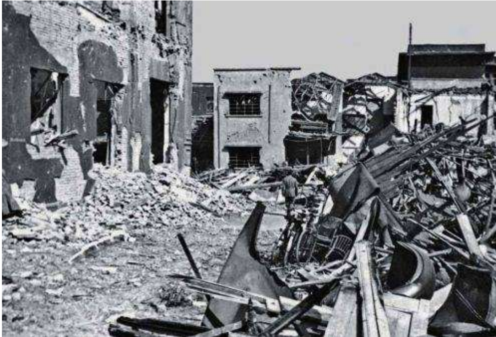
La fabbrica di aerei varesina Aermacchi dopo il bombardamento

E' quasi mezzogiorno di domenica, 30 aprile, una luminosa giornata di primavera, quando Varese sente nuovamente il rombo degli aerei alleati, il fischio terribile delle bombe e le esplosioni.