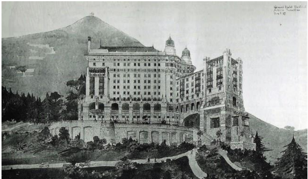
Disegno prospettico del primo progetto di Giuseppe Sommaruga Monneret 1908, tav. 17.

Nel 1908 arriva la prima figurazione, realizzata a mano da Giuseppe.